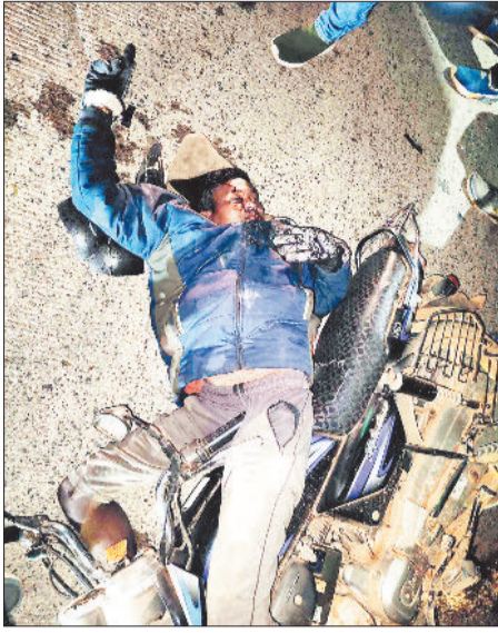
घटना स्थल पर घायल बाइक सवार।

एनएच 43 पर आए दिन दुर्घटनाएं होती रहती है। लुचकी घाट से लेकर कुनकुरी के बीच अब तक कई सड़क हादसा हो चुके हैं जिसमें कई लोगों की मौके पर ही मौत हो चुकी है। इसी तरह एनएच 130 पर हालही में कई सड़क दुर्घटना हुई जिसमें वाहन सवार के साथ पैदल जा रहे लोगों की